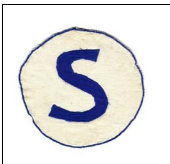
Swift embleem 1950