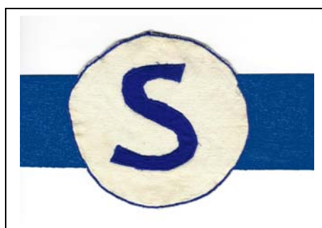
Swift embleem 1975