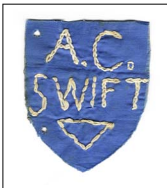
Swift embleem 1936

In 1985 wordt er door een lopersgroep binnen de vereniging een apart tenue ontworpen. Deze lopers, de Swift Runners, die onder leiding staan van Gé Krekelberg dragen een afbeelding van een wild zwijn op hun witte shirts. Later wijzigt dit en wordt er gelopen met de afbeelding van enkele gestyleerde lopers op het shirt.