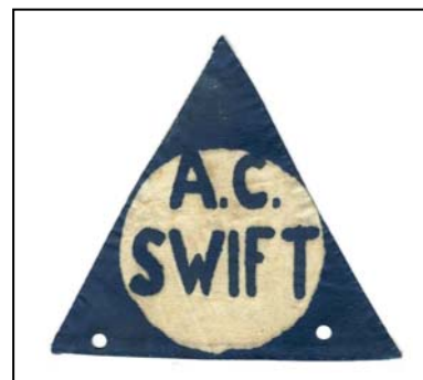
Swift embleem 1939